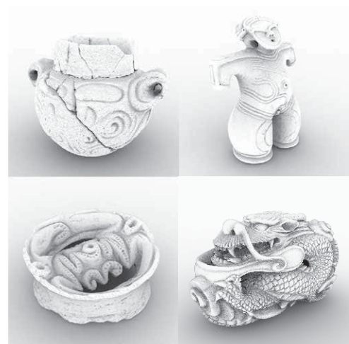
図1 Web3D化されたデータの一例

「デザインアーカイブ」 _____ 2種 スタンドアロン型についてはFilemakerPRO、Webサイト型についてはWordpressを用い動的データベースを作製した (図2)。