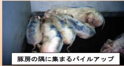
豚房の隅に集まるパイルアップ