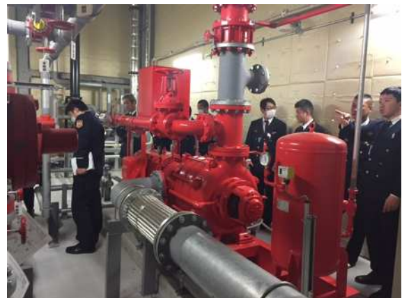
査察実習（イオンモール甲府昭和）