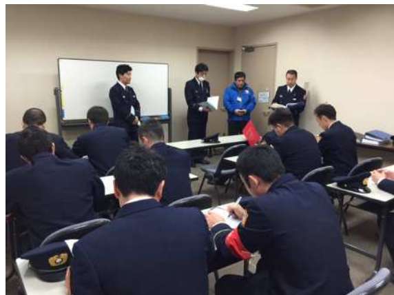
査察実習(県立科学館)