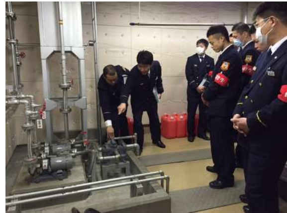
査察実習（県立科学館）