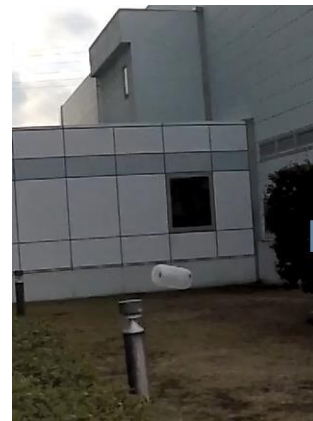
図2 落下衝撃試験の様子

本装置の耐衝撃性とIoT機能の簡易な評価を行うため、落下衝撃試験を実施した。試験は当センターの敷地内において、本館6F（高さ約21m）から自由落下させることで行った（図2, 3）。その結果、IoT観測装置に損傷は無く、繰り返し利用できる状態であることを確認した。また、落下中、落下後においても本装置はデータ（加速度、位置情報等）を取得し続け、無線通信によりそれらをクラウドサーバに送信させている。これにより、都内で観測する共同研究者においても本試験の状況を遠隔地から把握することに成功した。