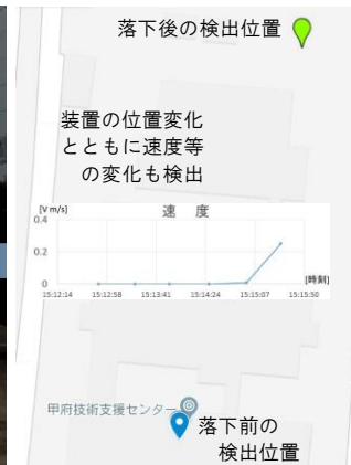
図3 遠隔地からのデータ評価