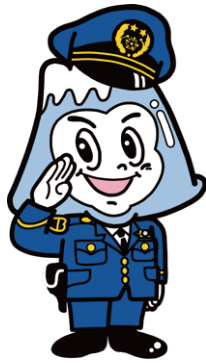
山梨県警察シンボルマスコット “ふじくん”