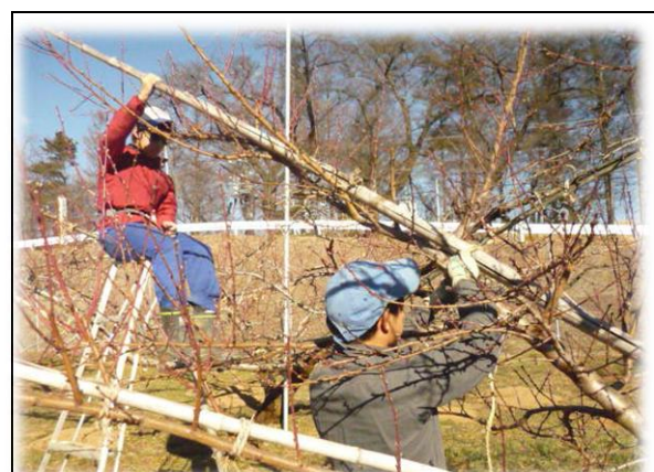
果樹学科・冬実習（モモの支柱立て）