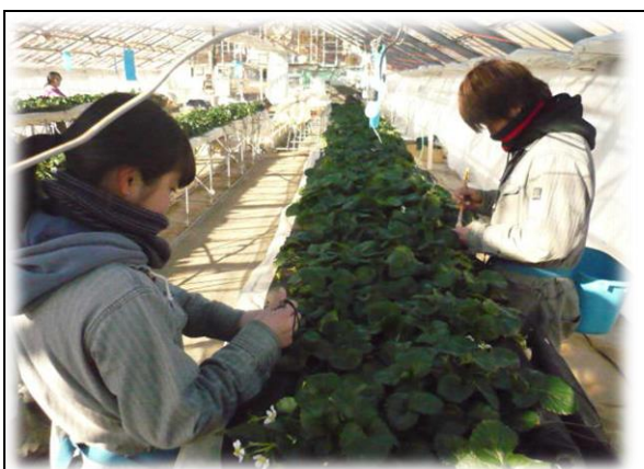
園芸学科野菜専攻・イチゴの手入れ