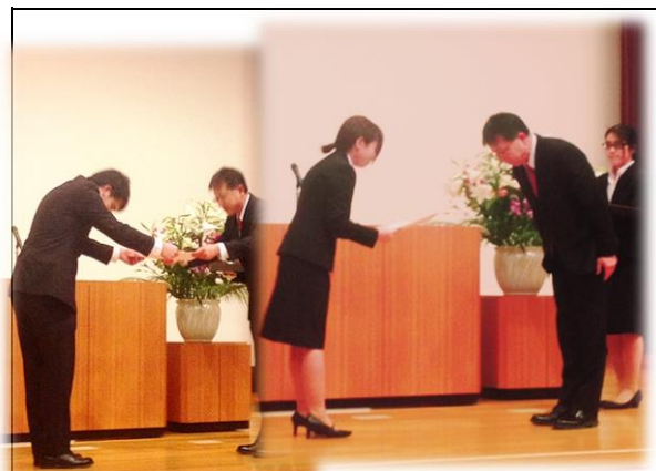
関東ブロック農業大学校等実績発表会養成科 第1位