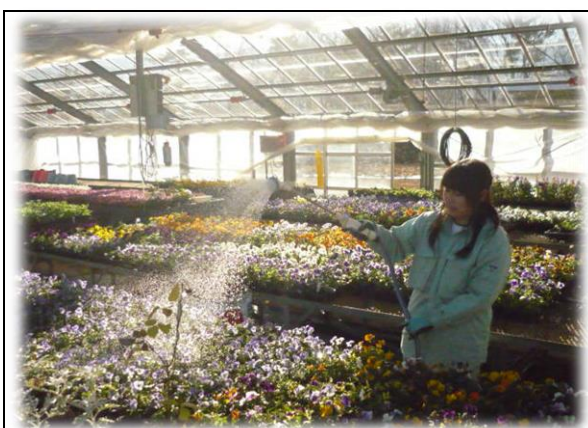
園芸学科花き専攻・ピオラかん水