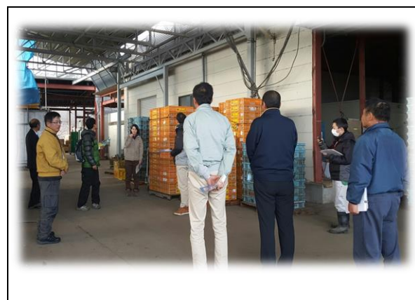
農大職員・高校職員合同研修会（営農塾マル二）