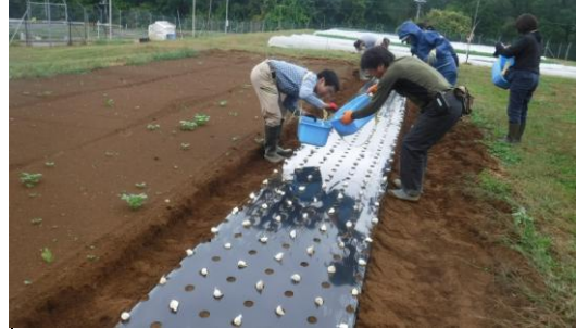
ニンニク 植え付け