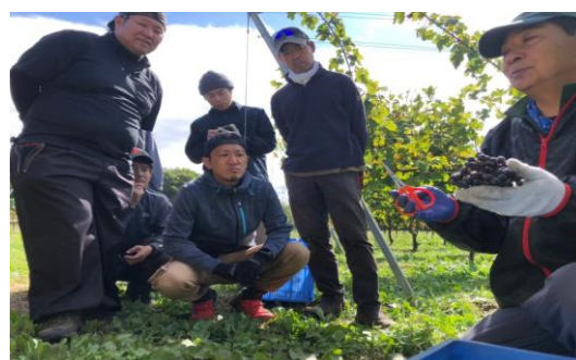
醸造ぶどう視察研修