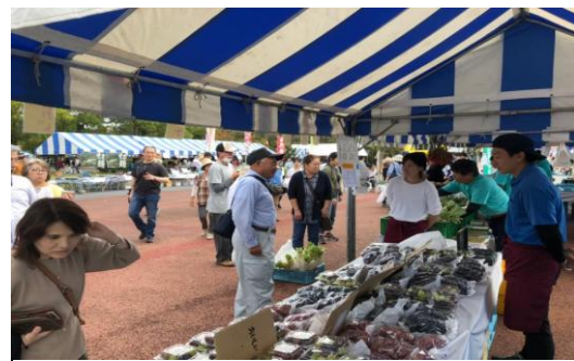
農業まつり販売実習