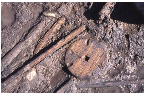
円盤状木製品の出土状況