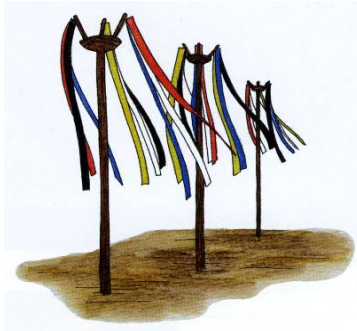
木製品組み合わせ想定図