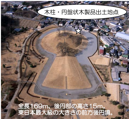
全長169m、後円部の高さ15m。 東日本最大級の大きさの前方後円墳。