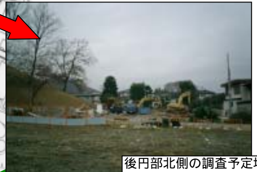
後円部北側の調査予定地