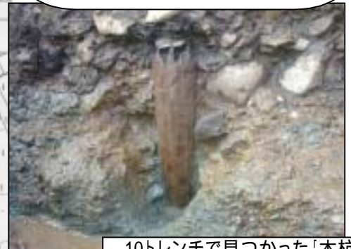
10トレンチで見つかった「木杭」