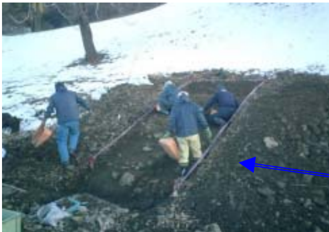
後円部北側の 5・6トレンチを調査中！見学会では出土した「埴輪」が見られるよ！