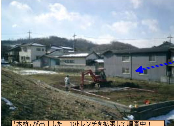
「木杭」が出土した 10トレンチを拡張して調査中！ 見学会では立ったままの「木杭」の本物が見られるよ！