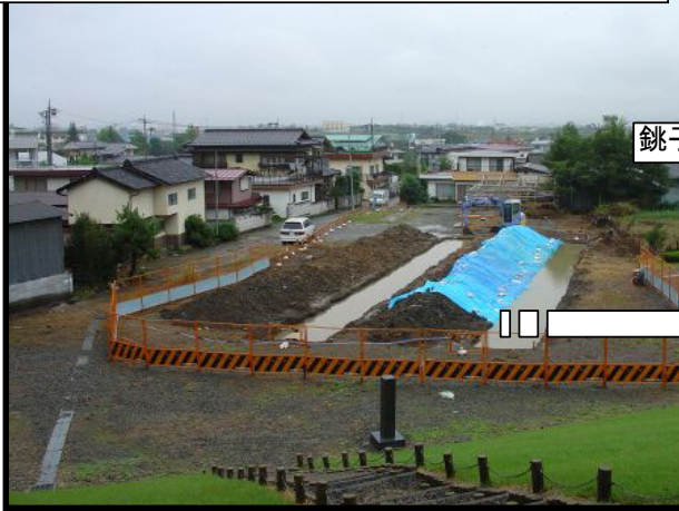
銚子塚古墳2004No.2. 3トレンチを墳丘上から見たところ

銚子塚古墳の試掘現場は連日の雨で水没しています。 でも、水没したトレンチの側面にはとても大事な土層が実は確認されているのです。 ちょうしづか新聞第10号の発刊を記念して特別に大公開しちゃいます。