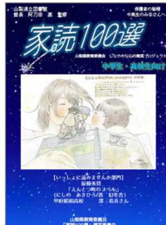
家読100選パンフレット (H29)