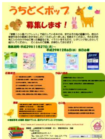
うちどくポップ展チラシ (H29)