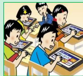
一人ひとりの習熟の程度等に 応じた学習