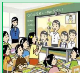
遠隔地や海外の学校等との 交流授業