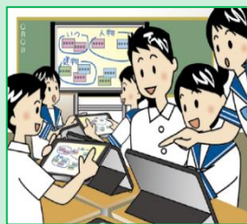
複数の意見・考えを議論して整理