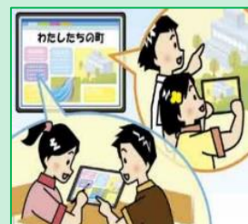
グループでの分担、協働に よる作品の制作