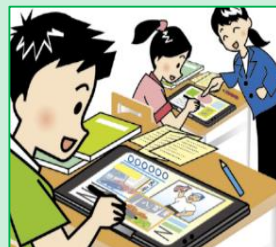
マルチメディアを用いた資料、 作品の制作