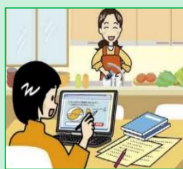
情報端末の持ち帰りによる家庭学習