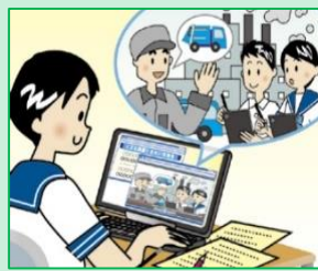
インターネットを用いた情報収集、 写真や動画等による記録