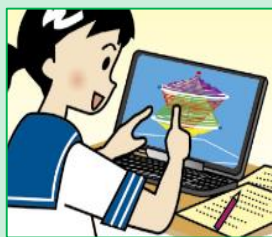
デジタル教材を用いた思考を深める学習