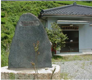
記念碑と陵草館 僅かに残る旧校舎