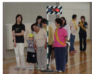
横断は、信号を良く確かめてから

6月22日(木)に、市川警察署管内交通安全母の会主催で、市川保育所の園児、父母、祖父母を対象にした三世代交通安全教室が、市川大門体育館でおこなわれました。当日は、交通安全指導員による講話を聞いた後、体育館内に設置した交差点を園児と父母、祖父母が組になって渡る実習、シートベルト・コンビンサーを使った衝突体験などを体験しながら、交通ルールやマナーを身につけました。