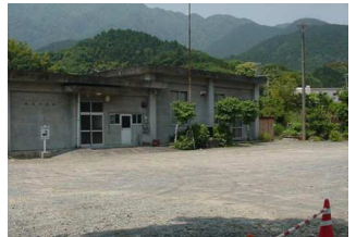
公民館前に建つ「学校 跡」の碑 旧校庭と楮根公民館