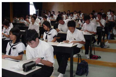
懐中電灯で放物線の仕組みを 調べる数学の授業(理数科)