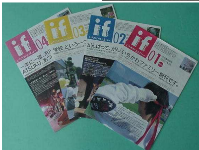
4月から発行されている学校通信のif(市川ファミリーの略)見易さ、内容とも他に類をみない水準です

内には学園祭のクラス展示や文化部の生徒達の作品も紹介されていて、この日だけでも市川高校の実際を肌で感ずることが出来ました。多くの先生方や生徒たちの積極的な取り組みが印象的な会を見て、あらためて、市川高校の先生方や生徒たちの日頃の熱気が伝わってきました。