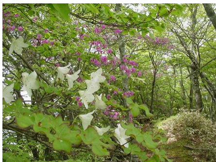
稜線上に咲くゴヨウツツジ(手前)とトウゴクミツバツツジ(奥)

朱や紫の鮮やかな花をつけるツツジの中で、ゴヨウツツジは、純白の花をつけます。平成13年12月1日に御誕生になった敬宮(としのみや)愛子内親王の