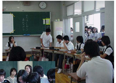
ディベート形式で進む国語の授業

当日は、高校生達の案内で広い校内を回りながら、実際の授業を見学したり体験する授業参観に続き、体育館で学校概要や入試の説明、音楽部のミニコンサート、高校生が学校生活の本音を語る市高しゃべり場などを聞いた後、希望のコースに分かれて部活動見学や英語科ワークショップなどを体験しました。