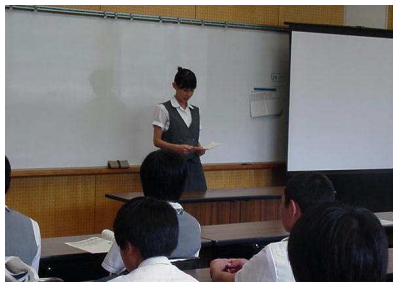
自らの体験を語ってくれた3年生

身延高校生の部活加入率は県内でもトップクラス。当日もインターハイに参加中の部を除いた多くの部が活動している姿に、中学生も熱い視線をおくっていました。