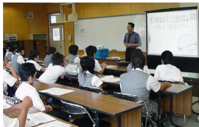
糖分摂取について考えてみる 家庭科の授業(普通科)