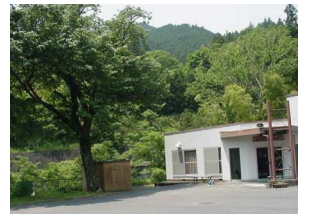
左) 幡竜橋付近から見た校舎: S30年代... 右) 校庭に残る桜の古木と公民館