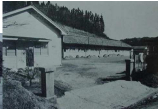
校門から見た校舎の 全景と校庭 校庭で体操をする子供 たち...万沢小提供