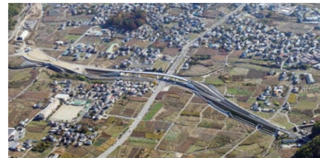
西関東連絡道路(甲府山梨道路)

「リニア環境未来都市」整備方針策定事業費 3,832万円 リニア駅周辺の土地利用や基盤整備などの方針を策定します。