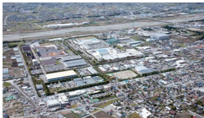
釜無工業団地(昭和町)

鳥獣被害回避作物栽培実証事業費 120万円 野生動物が嫌う農作物の栽培実証を実施します。