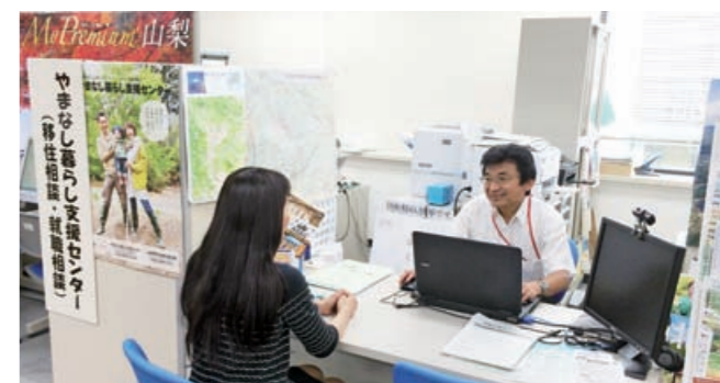
やまなし暮らし支援センター(東京・有楽町)

甲斐適住居移住サポート事業費補助金 300万円 空き家バンクの充実に向けた取り組みを行う市町村に助成します。