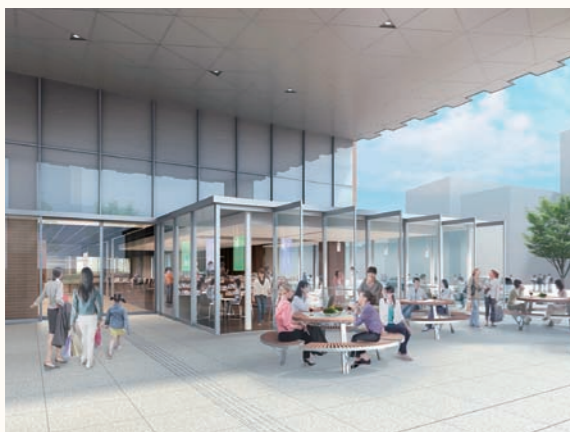
やまなしプラザ(平和通りから見たイメージ図)

平成25年10月に供用を開始する予定の防災新館1階「県民利用・商業施設」の名称が決定しました。応募総数511点の中から選ばれた「やまなしプラザ」は、以前この場所にあった県民情報プラザのイメージを残しながら、「県民に愛され、観光客も集う、にぎわいの広場(プラザ)」という意味が込められています。ジュエリーミュージアムやオープンカフェ、県民ひろばなどを整備し、甲府の中心市街地のにぎわいを創出する施設となることを目指していきます。