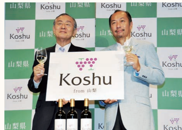
ブドウの房とワイングラスが一對となったデザインの「甲州ワインロゴマーク」をお披露目

山梨県のイメージアップと日本固有のブドウ品種「甲州」で造られた甲州ワインの認知度向上を目的に、「甲州ワインキャンペーン」を3月まで展開しています。キャンペーン初日の10月16日には、都内で雑誌編集者や報道関係者を対象に甲州ワインロゴマークとキャンペーンの今後の展開などを発表。また、会場では国際ソムリエ協会、田崎真也会長が甲州ワインの香り・味などを紹介するティastingセミナーを開催。来場者は甲州