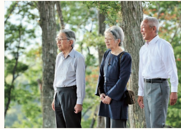
甲府盆地を囲む山並みが見渡せる展望広場で恩賜林の説明をお聞きになる天皇皇后両陛下

天皇皇后両陛下は、地方事情御視察のため、10月に来県されました。県立武田の杜保健休養林を訪問された両陛下は中核施設となる「健康の森」の森林学習展示館で「恩賜林100年の歩み特別展」を御覧になった後、展望広場から甲府盆地を囲む恩賜林を一望されました。県土の約3分の1を占める県有林の基となる恩賜林は、明治の末、大水害により大きな被害を受けた本県の復興のために、明治天皇から御下賜され、県民共有の財産として守り育てられています。