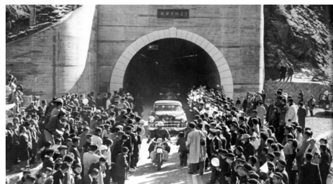
新笹子トンネル開通