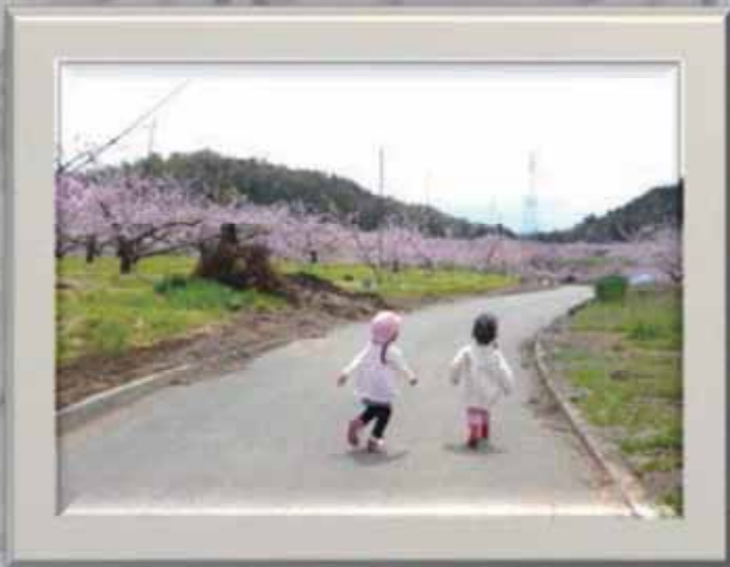
タイトル「桃の子」 撮影場所<韭崎市>