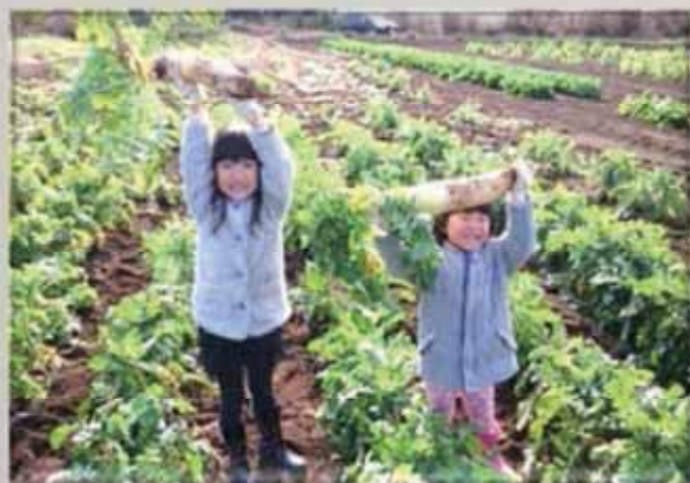
タイトル「とった〜」 撮影場所〈北杜市〉