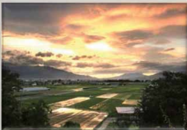
タイトル「茜色に染まる」 撮影場所〈中央市〉