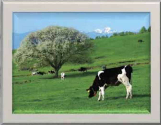
タイトル「ヤマナシの咲く頃」 撮影場所<北杜市>