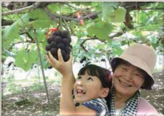
タイトル「大好きなぶどう」 撮影場所〈甲州市〉