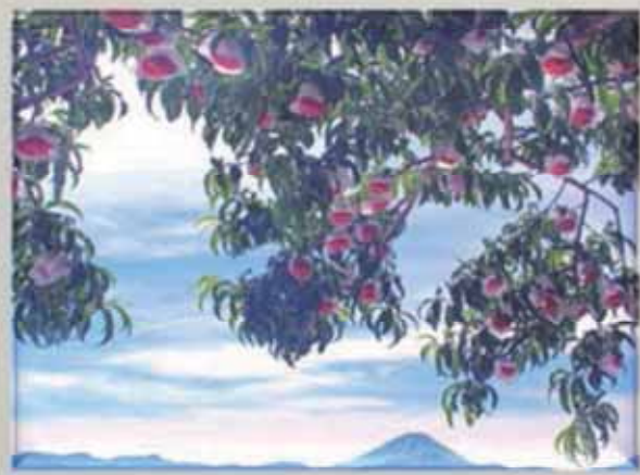
果実収穫の頃 撮影場所〈南アルプス市〉