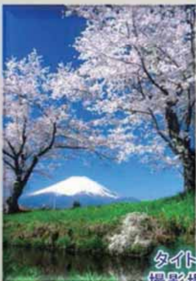
タイトル「忍野の春」 撮影場所〈忍野村〉