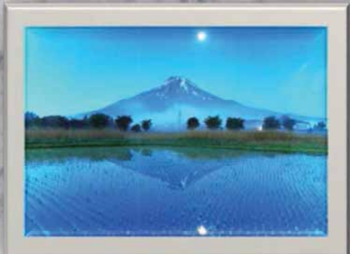
タイトル「命育くむ時間」 撮影場所<忍野村>