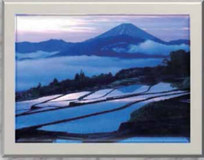
タイトル「雨上がりの朝」 撮影場所<南アルプス市>