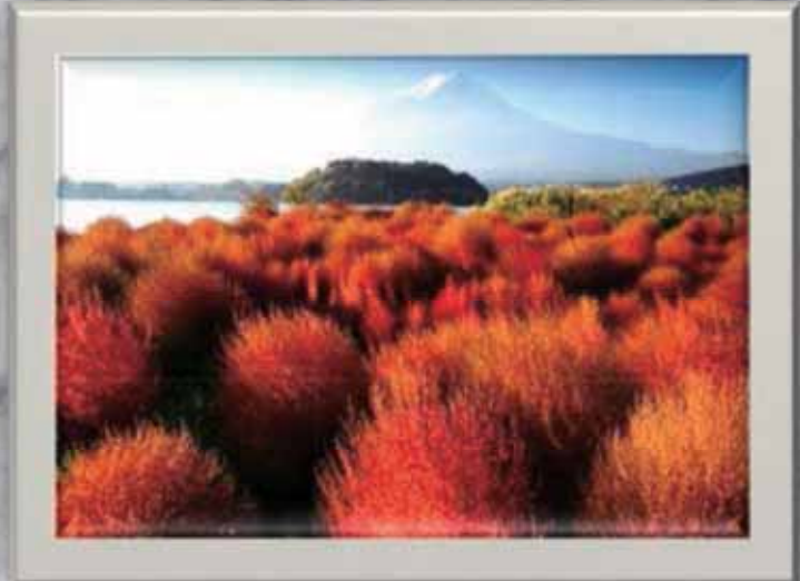
タイトル「ホーキ草の咲く頃」 撮影場所<富士河口湖町>