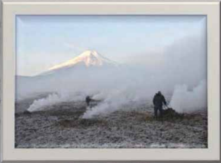
タイトル「冬の朝」 撮影場所<忍野村>