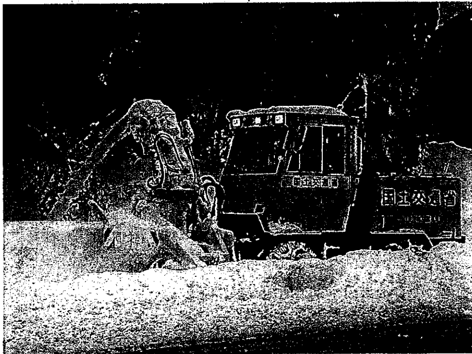
派遣する機械と同型のロータリ除雪機

TEC-FORCE隊員 10名 ロータリ除雪車 6台(オペレータ付(委託業者))