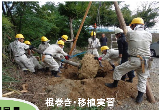
根巻き・移植実習