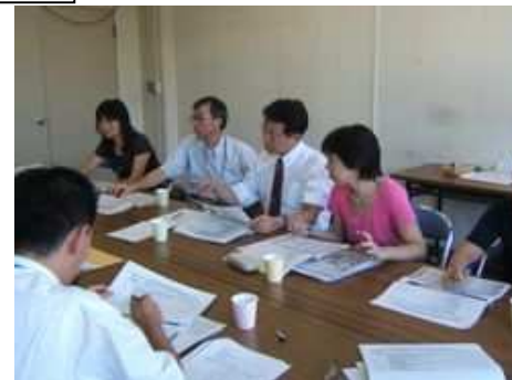
第2回がん対策推進協議会(平成21年10月13日)