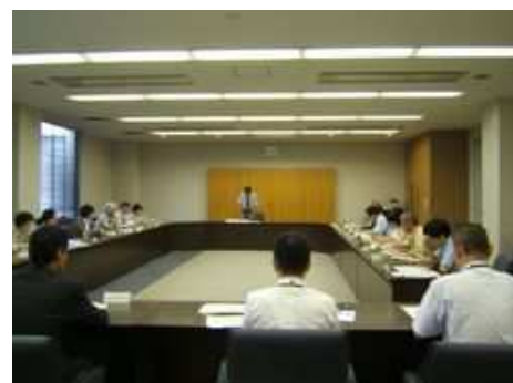
アクションプラン自由意見交換会(平成21年9月16日)