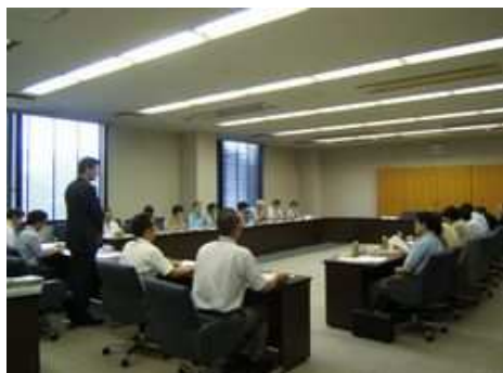
第1回がん対策推進協議会(平成21年8月7日)