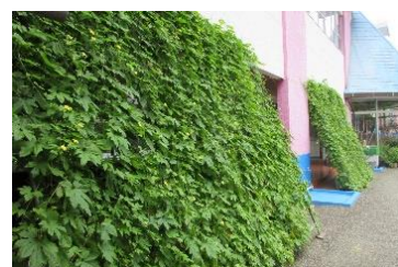
(団体の部) 竜王幼稚園