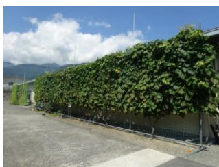
(団体の部) 富士通アイ・ネットワーク システムズ