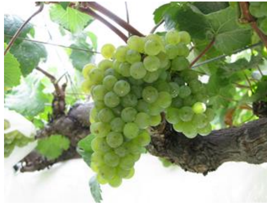
図2 「ブドウ山梨48号」の果実