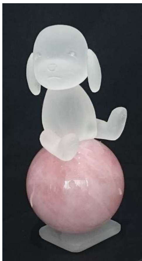
左のデザイン画が実制作されました