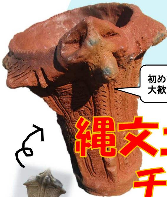
参加者 (中2) 作成