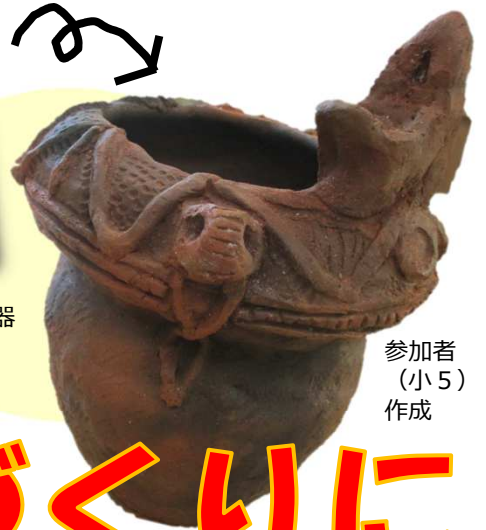
参加者 (小5) 作成