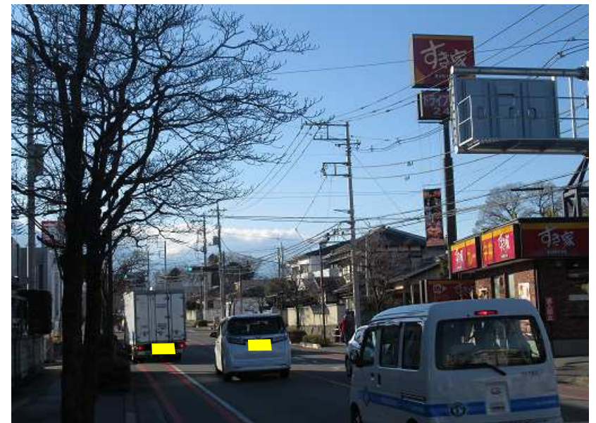
②当該路線は第二次緊急輸送道路に指定されている