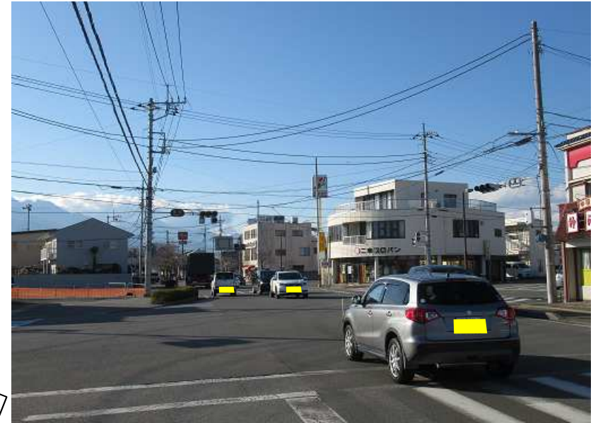
①道路近傍に電柱があり災害時に倒壊する恐れあり