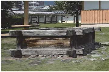
井戸（稲荷曲輪・数寄屋曲輪地区）