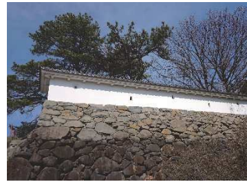
漆喰塀（二の丸地区）