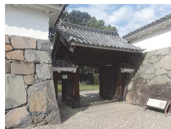
鍛冶曲輪門 （鍛冶曲輪地区）