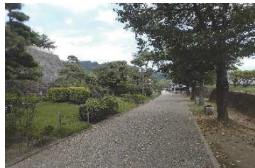
マツ、サクラ等（鍛冶曲輪地区）