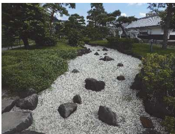
日本庭園（鍛冶曲輪地区）