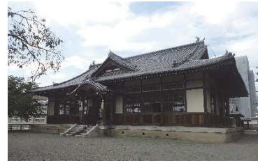
武徳殿（二の丸地区）