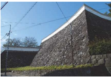
稲荷曲輪石垣（東側）