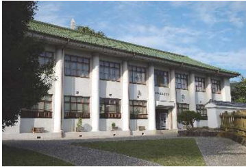
恩賜林記念館（鍛冶曲輪地区）