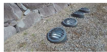
ライトアップ用照明