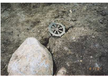
稲荷櫓跡出土輪宝