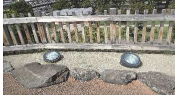
ライトアップ用照明