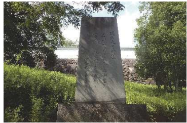
明治天皇御製碑（鍛冶曲輪地区）