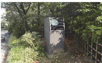
ライトアップ用照明