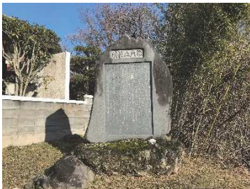
愛宕山山荘碑（石切場地区）