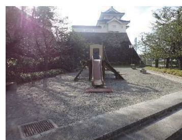
あじさい公園（堀地区（指定地内））