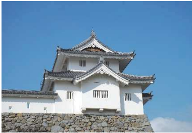
稻荷櫓 （稲荷曲輪・数寄屋曲輪地区）