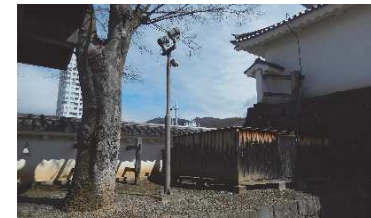
ライトアップ用照明