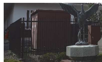
屋外キュービクル