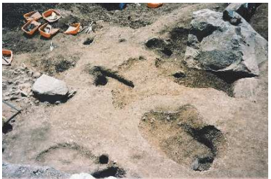
数寄屋勝手門階段石と柱穴