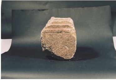
出土石造物（石垣中・二の丸地区）