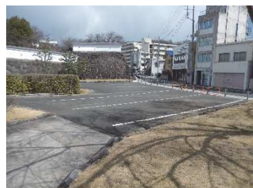
駐車場（堀地区（指定地内））