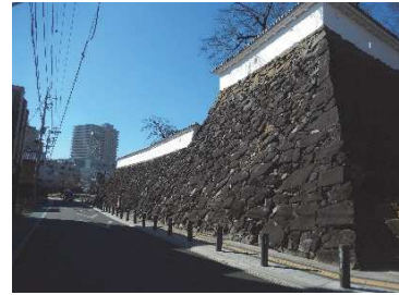
数寄屋曲輪石垣（東側）