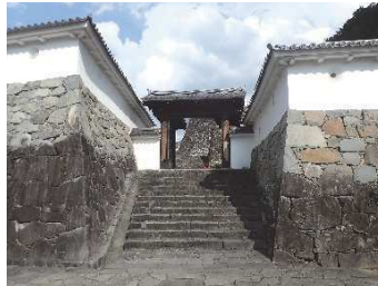
内松陰門（二の丸地区）