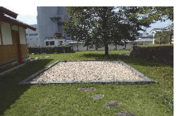
煙硝蔵（稲荷曲輪・数寄屋曲輪地区）