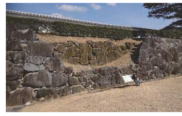
二重石垣（稲荷曲輪・数寄屋曲輪地区）