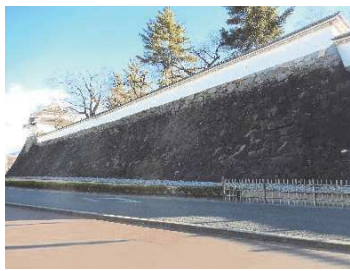
稲荷曲輪石垣（北側）