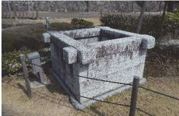
井戸（鍛冶曲輪地区）