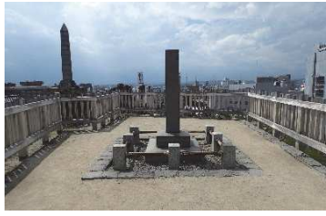
明治天皇御登臨之址（本丸地区）