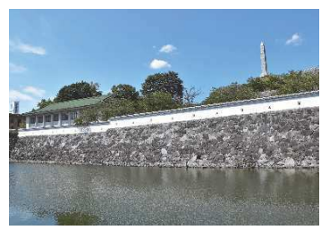
漆喰塀 （鍛冶曲輪地区）