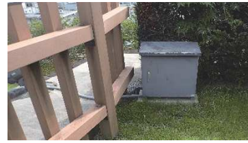
ライトアップ用照明電源盤