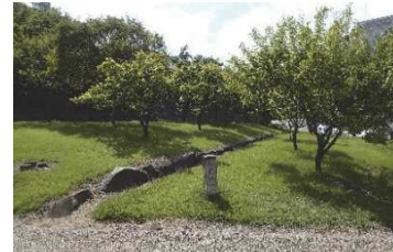
梅林（稲荷曲輪・数寄屋曲輪地区）