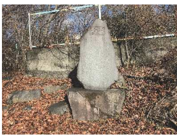
園記碑（石切場地区）