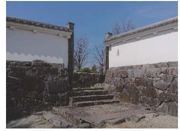
数寄屋勝手門 （稲荷曲輪・数寄屋曲輪地区）