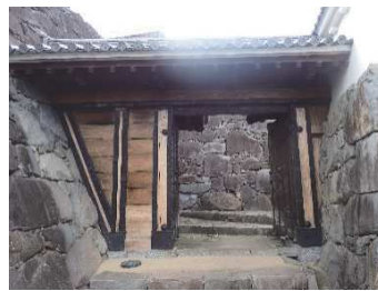
稲荷曲輪門 （稲荷曲輪・数寄屋曲輪地区）