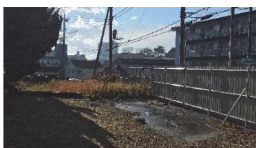
進入防止フェンス