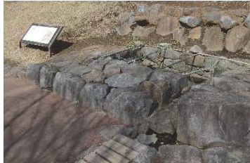
石組水溜（鍛冶曲輪地区）