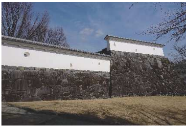
漆喰塀 （稲荷曲輪・数寄屋曲輪地区）