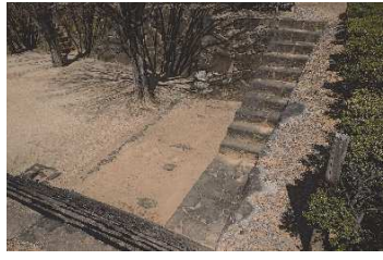
礎石（稲荷曲輪・数寄屋曲輪地区）