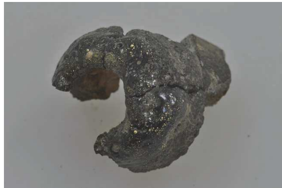
④甲府城下町（古府中環状浅原橋線地点） 〈No.158・167〉金が付着したフイゴ羽口