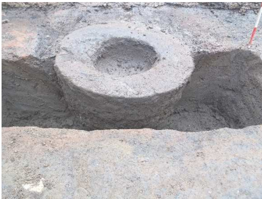
③甲府城下町（古府中環状浅原橋線地点） 〈No.158・167〉石臼出土状況