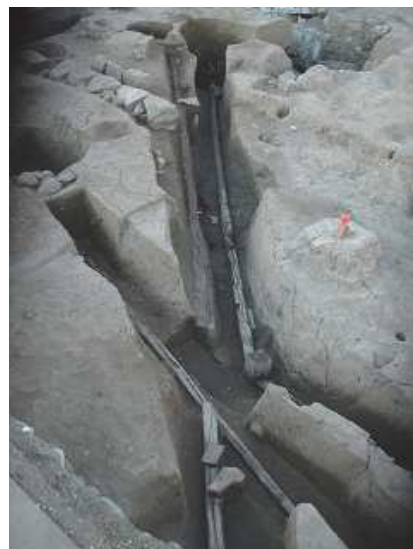
⑦甲府城下町 〈No.106〉甲府上水