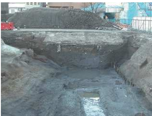
⑥甲府城下町 〈No.106〉二の堀土層堆積状況