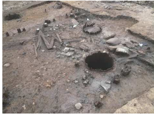
②甲府城下町（甲府市役所庁舎） 〈No.143〉庭園の泉水・井戸