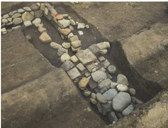
⑤旧尊躰寺推定地 〈No.204〉 石組溝（土塁を崩して構築）