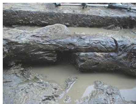
楽屋曲輪南側の石垣下の胴木