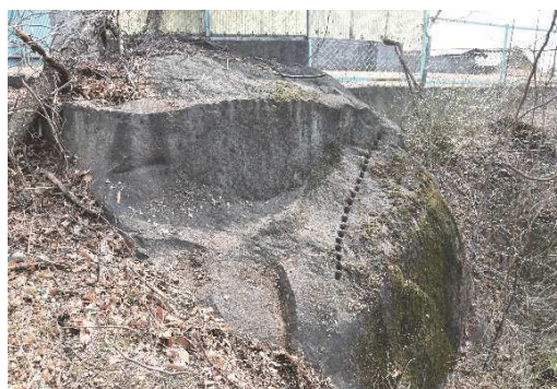
矢穴のみられる安山岩

平成19年度に法務省甲府地方裁判所所長庁舎解体事業に伴い試掘調査を行ったが、湧水のため、限定的な成果にとどまった。採石地点は現在、池となっており、周囲の地盤は割りガラで地盤が形成されていることから、現地で加工も行っていただようである。加工石材の確認調査では、約二寸(5~6cm)の幅の矢穴が入った石材や大正時代以降のルートハンマーの痕跡が確認されるなど、継続的に採石が行われていたことが窺えた。指定地周辺からも矢穴が残る残石も存在しており、広域に採石されていた可能性がある。