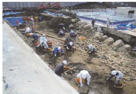
山梨県防災新館建設に伴う発掘調査

平成30年度に楽屋曲輪東側で実施した甲府城周辺地域活性化実施計画に伴う確認調査〈No.9〉では、築城期の野面積み石垣の根石と胴木、石垣前面に設置された腰石垣を確認した。