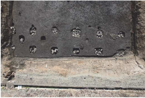
①甲府城下町（駅前駐輪場地点）〈No.165〉 建物跡（SB01）