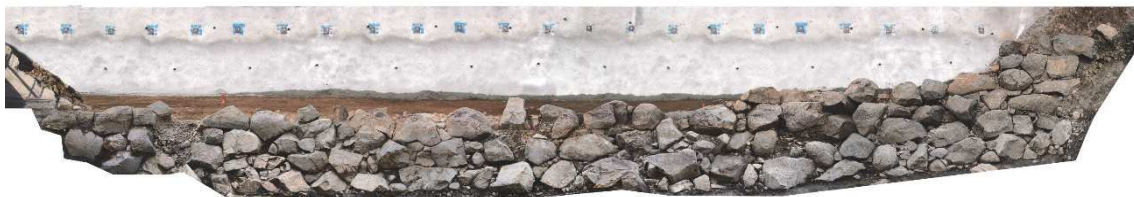
楽屋曲輪南側の石垣