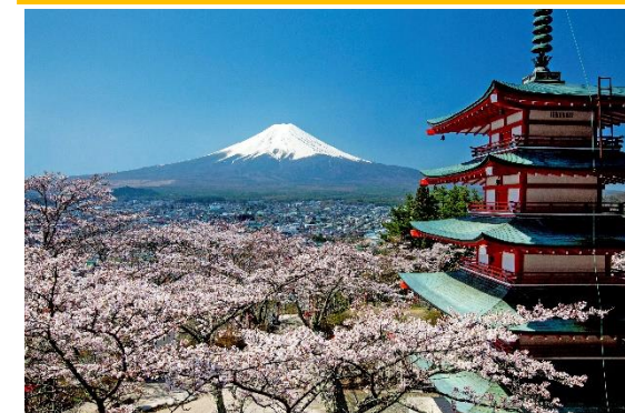
新倉山浅間公園から望む富士山

富士山に抱かれた自然環境は、市民にとって大きな誇りであるとともに、限りない恩恵を与えています。現在も、自然との調和を保ちながら、富士山とともに歩む国際都市として発展しています。