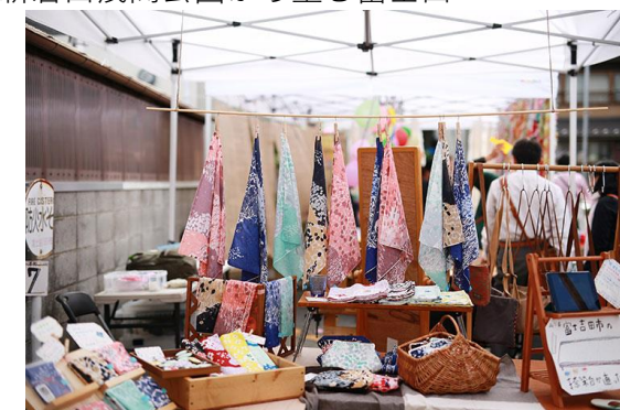
織物産業「ハタオリ」を伝えるハタフェス