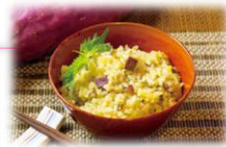
あけの金時 太陽のめぐみごはん (ふれあい vol.42)