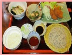
ヒシカツそばセット

★健康増進課 HP→ http://www.pref.yamanashi.jp/kenko-zsn/index.html