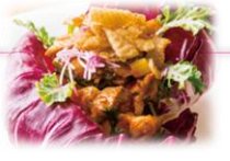
甲州地鶏と野菜のトマト煮 (ふれあい vol.49)

↑ レシピは、 県広報誌ふれあいHPで紹介しています！ http://www.pref.yamanashi.jp/koucho/fureai.html