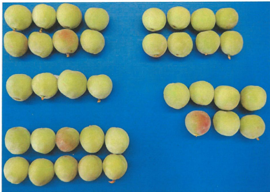
第4図 幼果における形状のバリエーションの分類（満開50日後）

左上段：縫合線と反対側の果頂部が膨らんだ“いびつ果” 左中段：果頂部が大きく凹んだ“いびつ果”， 左下段：正常果， 右上段：果頂部が平らな“いびつ果” 右中段：果頂部がわずかに凹んだ“いびつ果”