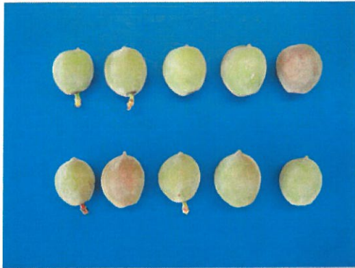
第2図 満開40日後の幼果 上段：いびつ果，下段：正常果