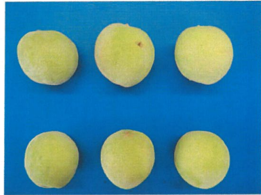
第3図 満開50日後の幼果 上段：いびつ果，下段：正常果