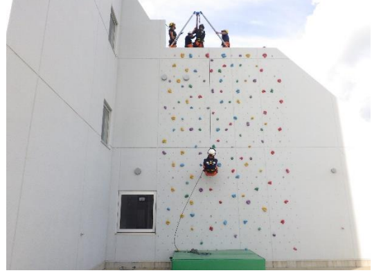
高所からの救助（講師：富士五湖消防本部）