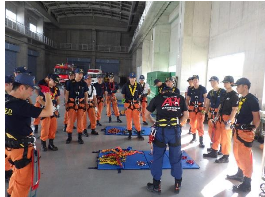
資器材取扱い (消防学校)