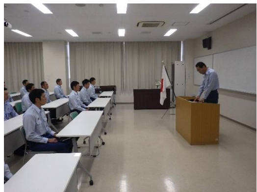
応用訓練・想定訓練 （講師：甲府地区消防本部）