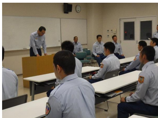
入 校 式