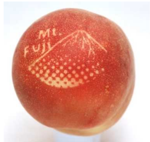
図3 図柄等を入れたモモ果実（「なつっこ」, 2017）