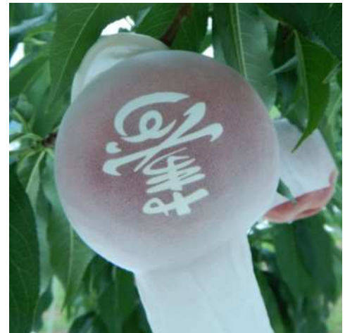
図2 メッシュ資材で被覆した果実