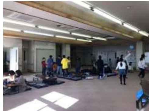
子ども食堂での学習支援と遊び支援