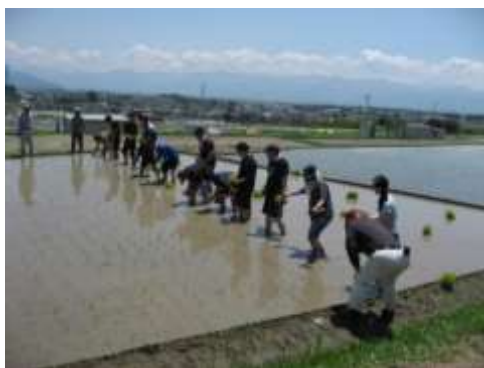
体験活動（田植え）支援

始まったばかりのプロジェクトですが、少しずつ関係機関との連携が強くなっており、成果も出てきているため、これからも本プロジェクトの周知・推進を図っていきます。