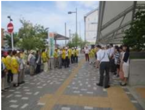
社会を明るくする運動への参加