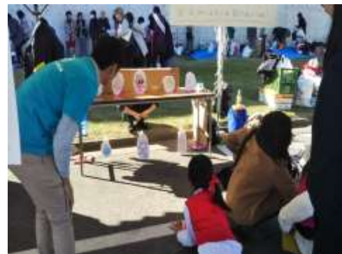
甲府刑務所矯正展でのブース出展