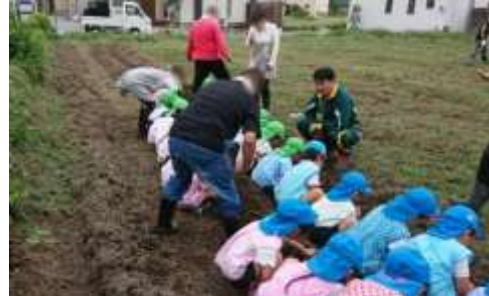
農作業プログラム

予防啓発活動として、矯正施設、学校、各種団体等における講演等を行い、薬物事犯者の再犯予防、地域における薬物問題の予防、若年層の薬物乱用防止を呼びかけています。