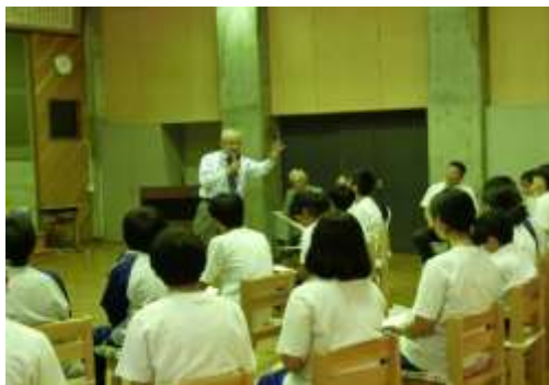
保護区の活動『命の授業』

各保護司は13の保護区（甲府・峡中・山梨・甲州・笛吹・峡南・峡北・南アルプス・鵜沢・大月・上野原・都留・富士吉田）にそれぞれ所属し、保護司会を組織しています。山梨県保護司会連合会はこれらの保護司会によって組織されています。