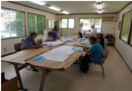
フォローアップ（軽作業）

フォローアップでは、仲間とともに軽作業を行うことにより、退所した人の孤独感の解消、金銭・健康管理、就労の喜び、精神的な安定を得ることで再犯の防止にもつながっており、フォローアップを開始して以来、再び罪を犯す人は出ていません。(令和2年2月末現在)