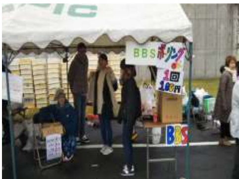
甲府刑務所矯正展でのブース出展