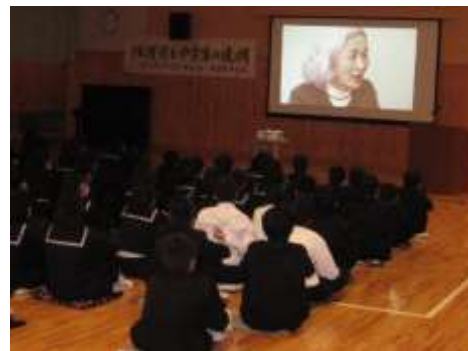
保護区の活動『保護司と中学生の連携』

同連合会では、保護司の諸活動の充実・強化及び保護司会が円滑かつ効果的に活動を遂行するために、必要な連絡及び資料の提供、情報の収集・発信等を行っています。