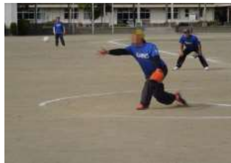
地域交流ソフトボール大会