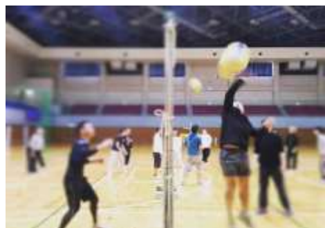
スポーツプログラム