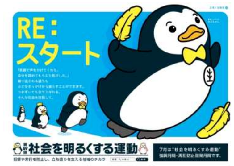
第69回“社会を明るくする運動”広報用ポスター

“社会を明るくする運動”は、全ての国民が、犯罪をした者等の更生について理解を深め、それぞれの立場において力を合わせ、犯罪や非行のない地域社会を築くために行う全国的な運動です。