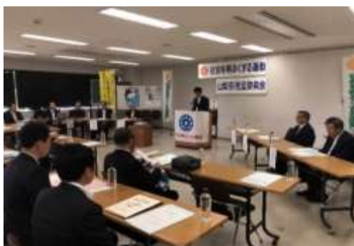
山梨県推進委員会

平成30年に実施された“社会を明るくする運動”には、11,636人の方が参加していますが、さらに広く県民へ周知・啓発し、参加を促していく必要があります。