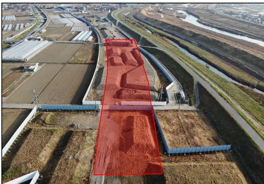
【 上空からドローンにて現場を撮影 】

3月から本格的に作業に入りますが、長期間の工事に加えて土砂運搬作業も非常に多い工事となっていますので作業を進めるうえで、地域の皆様にご迷惑をお掛けしないよう最善を尽くしますので何卒ご協力のほどよろしくお願い致します。