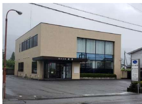
株式会社東栄様ホームページより

株式会社東栄様は、1964年（昭和39年）に設立し、社員の技術力の向上と安全第一の考えのもと、技術力・設備力・安全教育に力を注ぎ、甲州地域はもとより山梨県下で確かな仕事に取り組んで参りました。受け継がれる世代に「造る技術と創るやさしい環境」をスローガンに産業廃棄物再生材プラント、排気ガス対応車など環境に配慮した設備を導入し、技術と環境に調和した取り組みを行っています。今後も更なる向上心を持ち、未来を造るなかに未来を創る気持ちを持ちながら地球環境にやさしい企業として、努力を重ねて参ります。