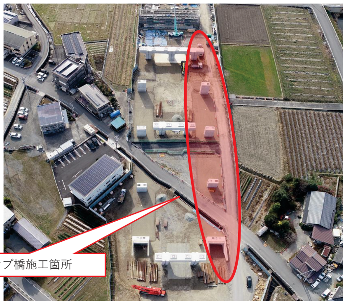
オフランプ橋施工箇所