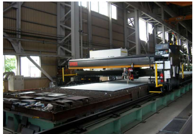
材料切断状況(NCLレーザー切断機)