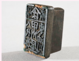
甲州屋の印鑑 (山梨県立博物館蔵)