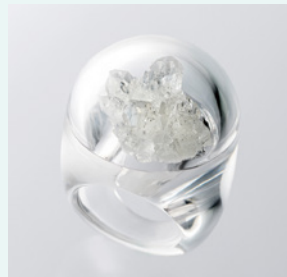
リング(Crystal Dome) デザイン&制作: 貴石彫刻オオヨリ 大寄智彦