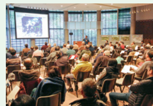
平成30年度のスキルアップセミナーの様子

富士山とその周辺の自然ガイドに役立つ、基礎的な知見や新たな研究成果を専門家が紹介するセミナーです。1月は「冬の植物」、2月は「雪崩、雪代」、3月は「富士信仰」がテーマです。