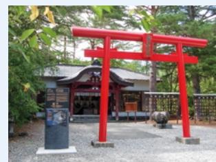
船津胎内樹型入口に建立された無戸室浅間神社

富士山麓に点在する溶岩洞穴の中には、船津胎内樹型(富士河口湖町)のように、信仰の対象となったものが少なくありません。本展では、溶岩洞穴をめぐる展開した信仰について紹介します。