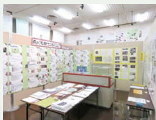
第16回展示会の様子

小中学生が歴史や考古学について学び、研究した成果を一堂に展示します。子どもたちの自由な発想から生まれた貴重な研究成果の数々を、ぜひご覧ください。