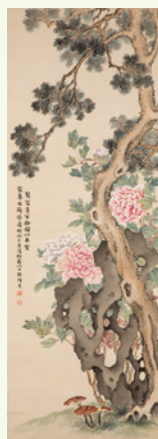
野口小蘋「富貴百齡図」 1892(明治25)年

開催期間／2月8日(土)～3月8日(日) 観覧料／一般520円 大学生220円 ※各種割引などあり。詳しくはお問い合わせください。