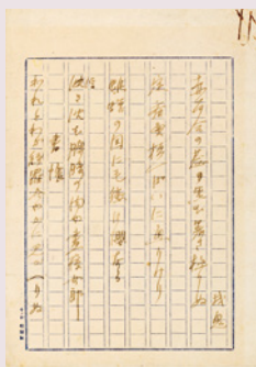
芥川龍之介 句稿「赤百合の芯黒む暑さ極りぬ」ほか (山梨県立文学館蔵)