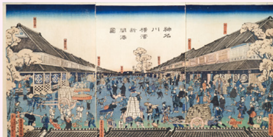
神名川横浜新開港図 (山梨県立博物館蔵)

開催期間／～2月24日(月・振休) 観覧料／一般520円 大学生220円 ※各種割引などあり。詳しくはお問い合わせください。