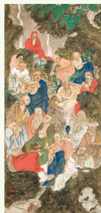
富岡鉄斎「十六羅漢図」 1896(明治29)年