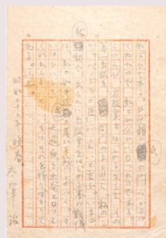
太宰治 「あとがき」原稿(『バンドラの匣』再版収録) (山梨県立文学館蔵)