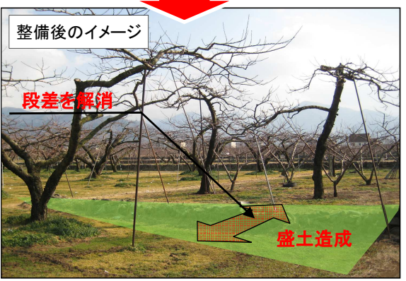
⑥ ほ場内の段差を解消することで、連続した機械作業が可能となる