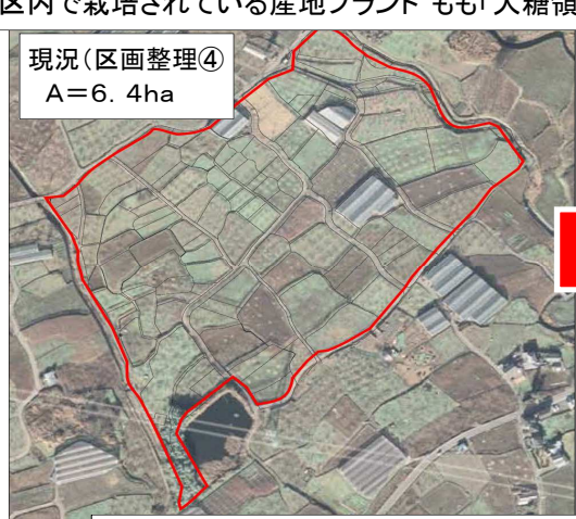
③ 1区画が狭小で不整形の農地を、区画整理により集積・集約化することで作業効率の改善を図る。