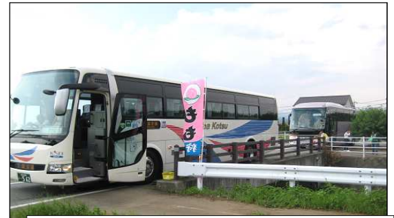
⑤ 地区内に乗り入れのできない観光バスは地区端部にて観光客が乗降しており、観光入り込み客の増加や観光農園面積の拡大に向けて課題となっている。