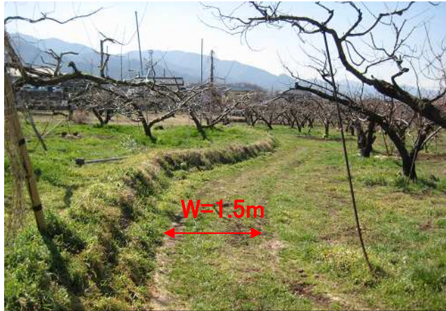
① 未整備で狭小な農道は農作業車両の通行に支障があり作業効率が悪い。