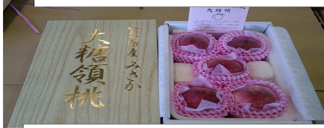
② 地区内で栽培されている産地ブランド もも「大糖領」