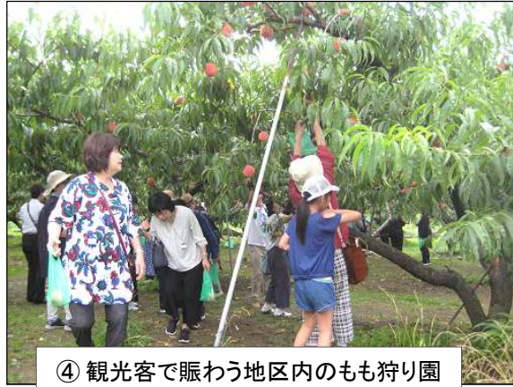
④ 観光客で賑わう地区内のもも狩り園