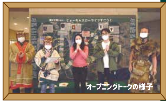
オープニングトークの様子

文王国山梨実行委員会では、例年 JR 甲府駅北口にて盛大に開催していた『JomonFES』に代わるイベントとして、3月7日(日)に縄文の専門家を招いての『Jomon FES online』を Youtube で生配信しました。個性的なゲストのみなさんに挑戦していただいたのは、厳しくも楽しい(?) 縄文人生を体感できる、その名も『じょーもんスローライフすごろく』。縄文愛なら負けない! という意気込みのもと、ゲストのみなさんがミッションに悪戦苦闘しつつもワイワイと楽しんでいる様子が配信で伝わったでしょうか?