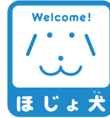
ほじょ犬 ほじょ犬マーク