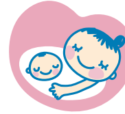
マタニティマーク