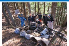
マウンテンバイクの地域活動