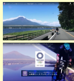
東京オリンピック自転車競技ロードレースコースPR