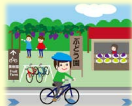
地域資源と組み合わせた自転車の活用イメージ