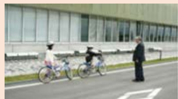
山梨県総合交通センターでの交通安全教室