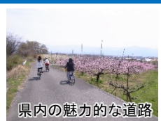
県内の魅力的な道路