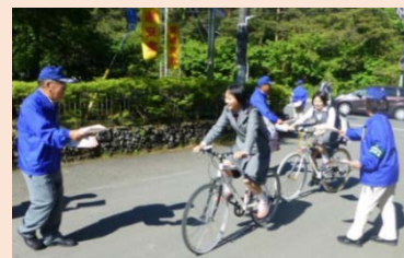
県内の交通安全運動