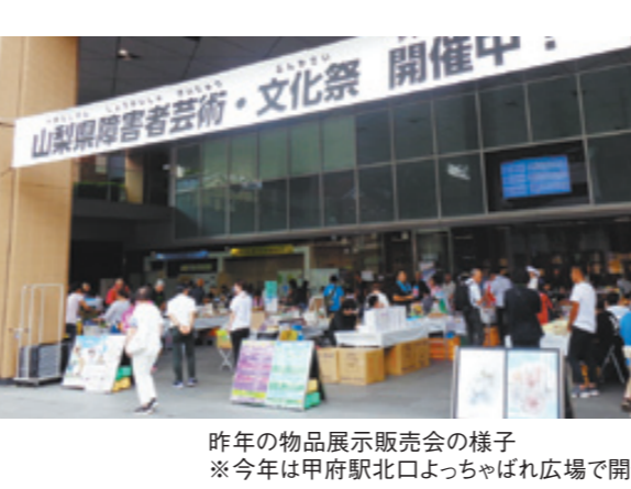
昨年の物品展示販売会の様子 ※今年は甲府駅北口よっちゃばれ広場で開催