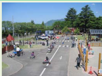
(左) 境川自転車競技場 (右) 山梨県森林公園 金川の森にあるスポーツの森・サイクルステーション