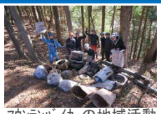
マウンテンバイクの地域活動