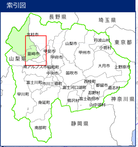
富士川水系釜無川洪水浸水想定区域図 （家屋倒壊等氾濫想定区域（河岸侵食））