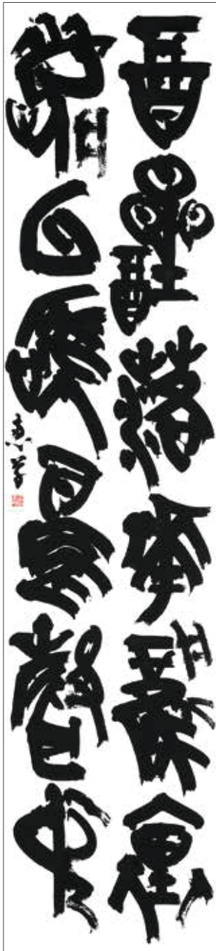
県民文化祭賞 漢字 「孫觀詩」 日永田恵草 (甲府市)