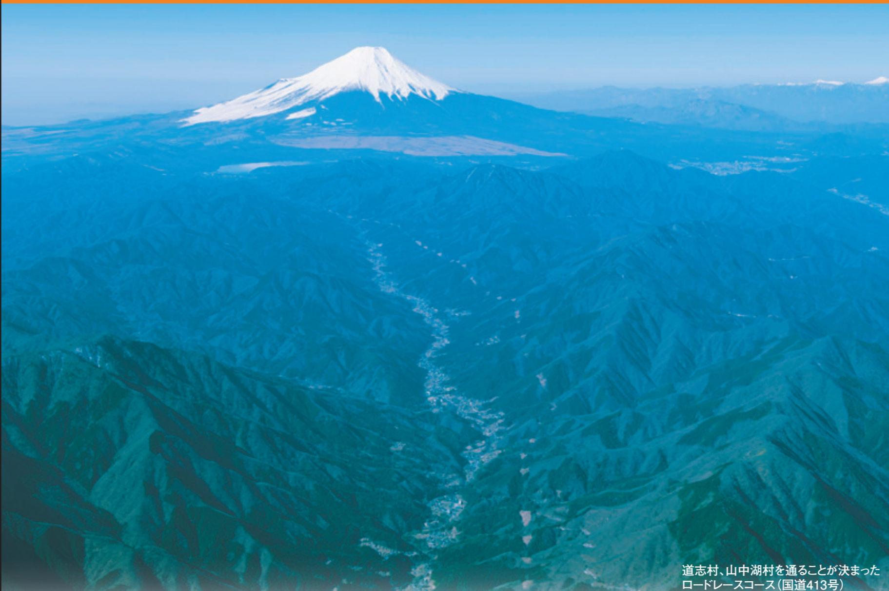
道志村、山中湖村を通ることが決まったロードレースコース(国道413号)