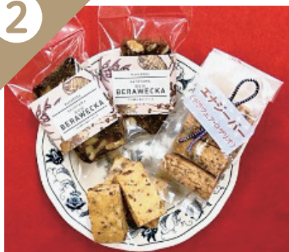
エナジーバー & ベラベッカ