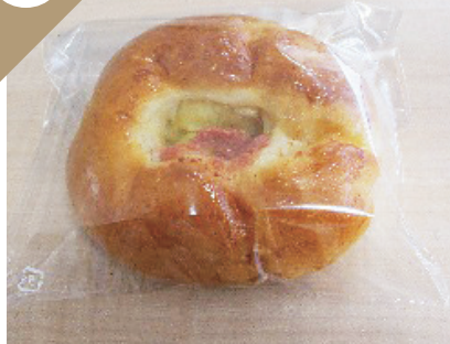
塩じゃがバター (明太)ぱん