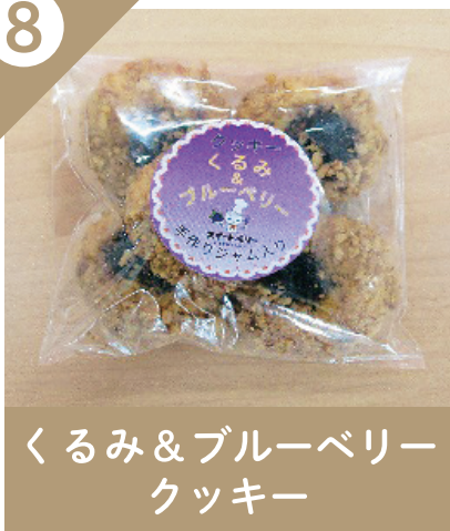
くるみ & ブルーベリー クッキー