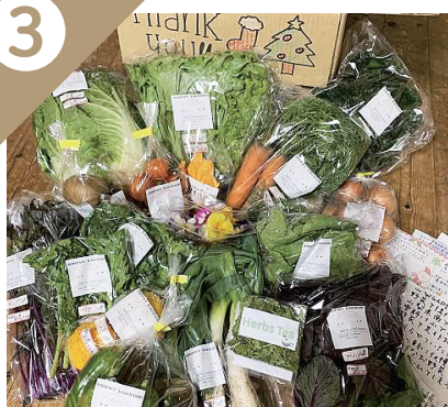
季節の野菜・ 果実