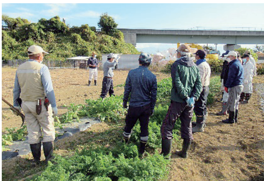
施設利用者等を対象とした講習会の様子