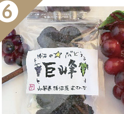
勝沼の ☆ぶどう(巨峰)