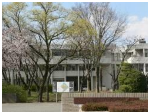
【山梨県総合教育センター】