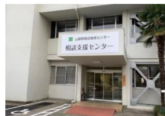
【相談支援センター】