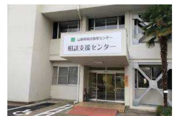
【相談支援センター】