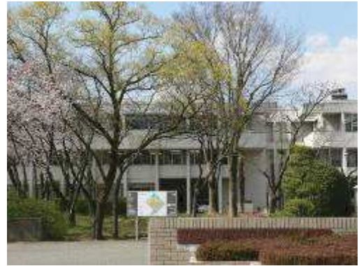
【山梨県総合教育センター】